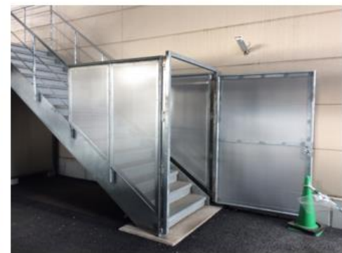
非常階段の出入口（1階）