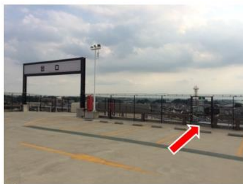
非常階段の出入口（屋上）